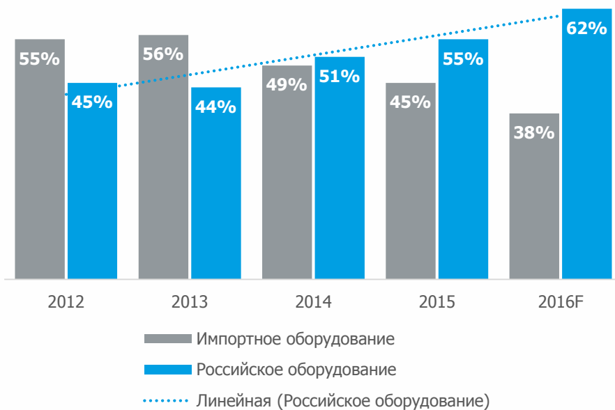
Доля импортного и российского оборудования

В 2014 году впервые за десятилетие доля российского оборудования превысила рыночную долю импортного.